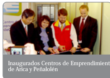
Inaugurados Centros de Emprendimiento de Arica y Peñalolén