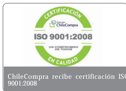
ChileCompra recibe certificación ISO 9001:2008